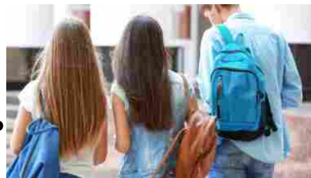
Scuola, si torna in classe: ecco le date di inizio regione per regione

Le notizie del sito Dire sono utilizzabili e riproducibili, a condizione di citare espressamente la fonte Agenzia DIRE e l’indirizzo www.dire.it