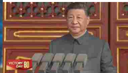
Parata della Vittoria in Cina, Xi Jinping: "Il mondo scelga tra pace e guerra"