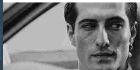
Truffata da un falso Damiano David, 45enne derubata di 15mila euro