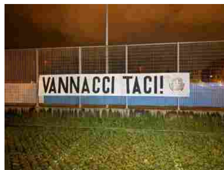
Casapound: "Vannacci taci". Striscioni in tutta Italia dopo le dichiarazioni favorevoli allo sgombero