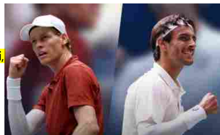
Us Open, Sinner contro Musetti: dove e quando vedere il match (anche in chiaro)