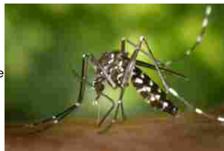
L'Oms lancia l'allarme Chikungunya, un altro virus trasmesso dalle zanzare

Le notizie del sito Dire sono utilizzabili e riproducibili, a condizione di citare espressamente la fonte Agenzia DIRE e l'indirizzo www.dire.it