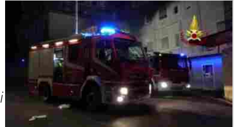
Un morto in un incendio a Milano: forse è stato ucciso e poi dato alle fiamme l'appartamento