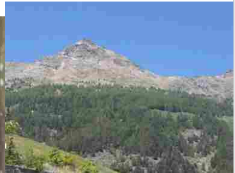
In Val D'Aosta un 15enne muore a 2000 metri: si era perso ed è caduto