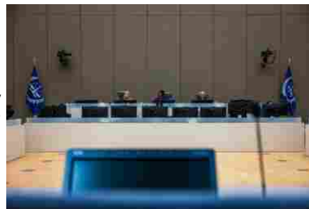
Uganda, il processo a Kony precedente anche per Putin e Netanyahu?

Le notizie del sito Dire sono utilizzabili e riproducibili, a condizione di citare espressamente la fonte Agenzia DIRE e l'indirizzo www.dire.it