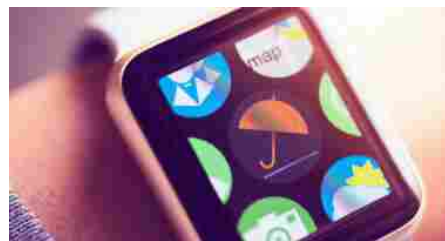
Meteo, le previsioni di mercoledì 15 ottobre

Le notizie del sito Dire sono utilizzabili e riproducibili, a condizione di citare espressamente la fonte Agenzia DIRE e l'indirizzo www.dire.it