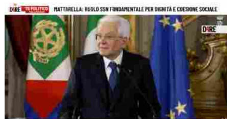
"Il Congresso della Federazione Nazionale degli Ordini della Professione Infermieristica"

Le notizie del sito Dire sono utilizzabili e riproducibili, a condizione di citare espressamente la fonte Agenzia DIRE e l'indirizzo www.dire.it