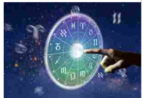
L'oroscopo di mercoledì 26 marzo 2025