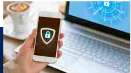
Twin4Cyber, nasce la start up che aiuta le aziende ad anticipare le minacce cyber