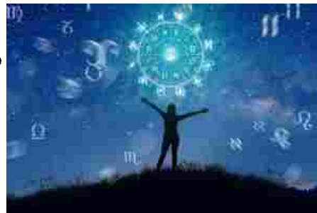
L’oroscopo di mercoledì 15 gennaio 2025

Le notizie del sito Dire sono utilizzabili e riproducibili, a condizione di citare espressamente la fonte Agenzia DIRE e l’indirizzo www.dire.it