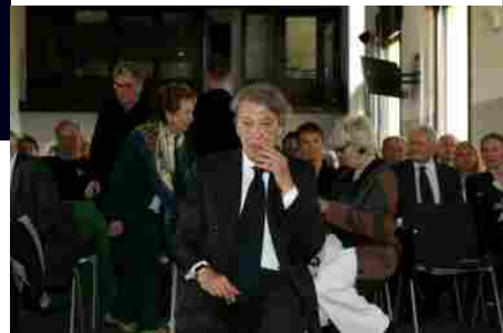
Massimo Moratti fa 80 anni: "Il Cardinal Martini mi chiese di fare il sindaco di Milano. Il rifiuto lo vivo come un peccato"