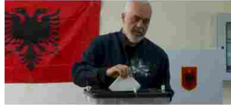
Tg Esteri, l'edizione di mercoledì 14 maggio 2025

DIRE Tg ESTERI ALBANIA. LEGISLATIVE. RICONFERMATO AL QUARTO MANDATO IL SOCIALISTA EDI RAMA