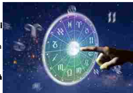
L'oroscopo di mercoledì 14 maggio 2025