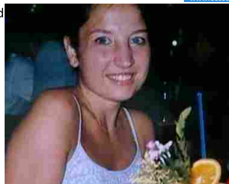
Garlasco, c'è una svolta? Blitz a casa di Sempio, e di due amici. Si cerca l'arma del delitto in un campo

Le notizie del sito Dire sono utilizzabili e riproducibili, a condizione di citare espressamente la fonte Agenzia DIRE e l'indirizzo www.dire.it