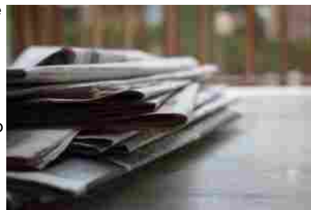
Le prime pagine di mercoledì 11 settembre 2024

Le notizie del sito Dire sono utilizzabili e riproducibili, a condizione di citare espressamente la fonte Agenzia DIRE e l'indirizzo www.dire.it