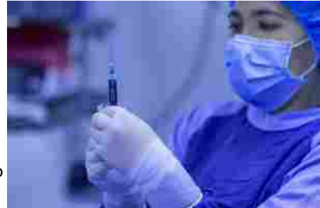
L'associazione per le vittime Covid: "Dal Governo di allora negligenza totale"