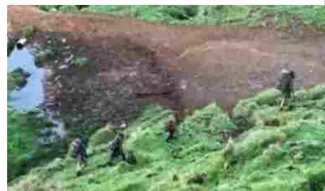
Fuggì con i tre figli nella giungla neozelandese, avvistati dopo tre anni dai cacciatori di cinghiali